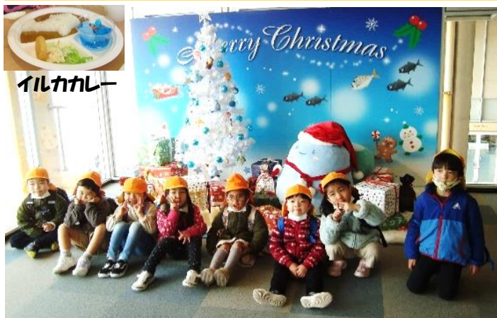
クリスマス仕様の水族館の前で“ハイポーズ”

帰りの藤沢駅前サンパール広場で、おやつを広げて、食べました。ちょっと疲れたけど、早めの昼食だったので、おやつはたくさん食べて大満足です。