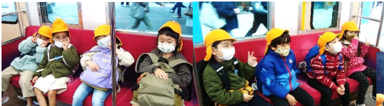
小田急に乗って出発!! 「なんかドキドキする!」

秋晴れの11月16日(火曜日)、年長(5歳児)の遠足に行ってきました。今回は子どものリクエストで江ノ島水族館になり、公共交通機関の小田急・江の島モノレール・JRと乗り継いでの楽しい旅?!になりました。