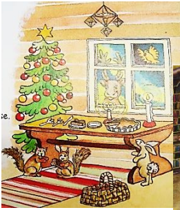
サンタさんの手紙