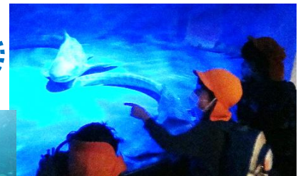
あのサメ大きいね! ずっとこっちみてるよ-!